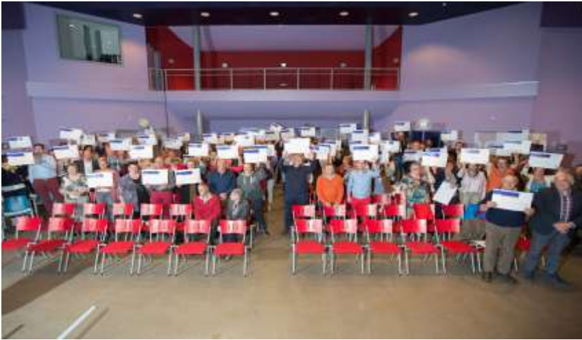
Deelnemers Raboclubkasactie in de Talter