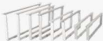
Alle maten ramen en was

Tongerenseweg-zuid 119 8162 SB Epe tel: 0578-795004/0611950583 www.honingmagazijn.nl e-mail: honingmagazijn@hetnet.nl