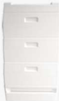
Onderdelen Segeberger & Frankenbeute