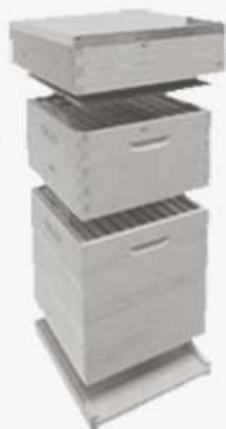
Onderdelen en kasten Dadant US en Blatt zowel in hout als in kunststof