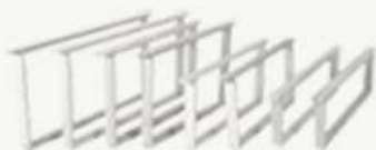
Alle maten ramen en was

Tongerenseweg-zuid 119 8162 SB Epe tel: 0578-795004/0611950583 www.honingmagazijn.nl e-mail: honingmagazijn@hetnet.nl