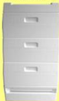
Alle maten kasten van kunststof en kastonderdelen