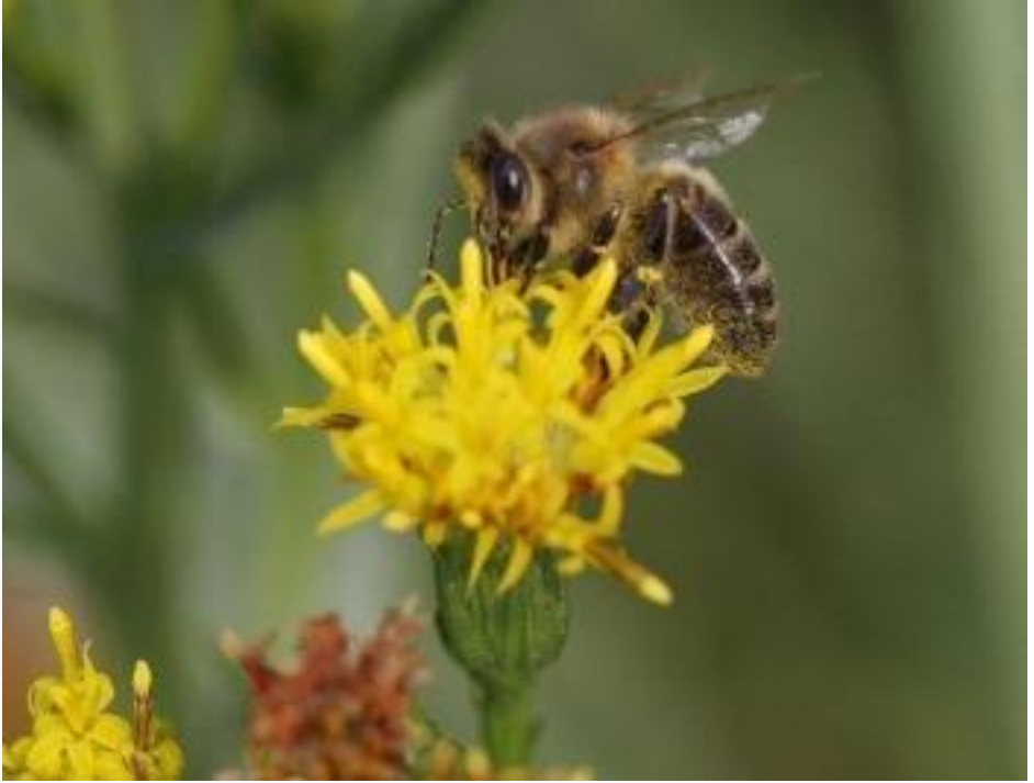
De honingbij op een zulte zonder lintbloemen.

Als zulte op grond staat met een relatief hoog zoutgehalte dan ontbreken de (licht-lila tot witte) lintbloemen, en resteert alleen het gele hart. De bloemen van de zulte zijn rijk aan nectar en stuifmeel en vormen voor onze honingbij een uitstekende najaarsdracht.