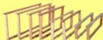
Ramen en was

Tongerenseweg-zuid 119 8162 SB Epe tel: 0611950583 www.honingmagazijn.nl e-mail: honingmagazijn@hetnet.nl