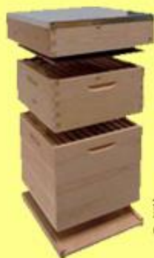
Alle maten kasten van hout en kastonderdelen