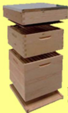
Alle maten kasten van hout en kastonderdelen