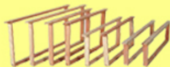
Ramen en was

Tongerenseweg-zuid 119 8162 SB Epe tel: 0611950583 www.honingmagazijn.nl e-mail: honingmagazijn@hetnet.nl