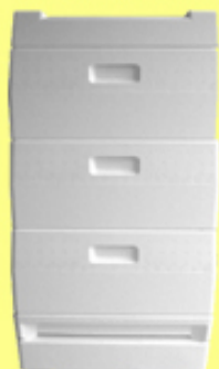
Alle maten kasten van kunststof en kastonderdelen