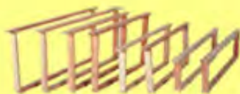
Ramen en was

Tongerenseweg-zuid 119 8162 SB Epe tel: 0611950583 www.honingmagazijn.nl e-mail: honingmagazijn@hetnet.nl