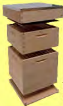
Alle maten kasten van hout en kastonderdelen