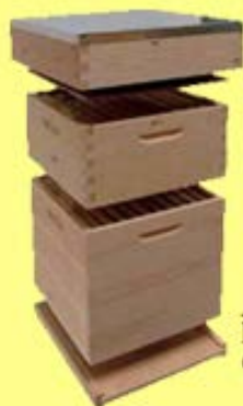
Alle maten kasten van hout en kastonderdelen