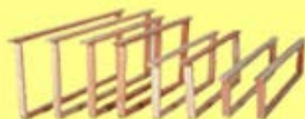
Ramen en was

Tongerenseweg-zuid 119 8162 SB Epe tel: 0611950583 www.honingmagazijn.nl e-mail: honingmagazijn@hetnet.nl